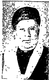
સ્વ. શ્રીશ્રી આંતારામ ભાણિકલાલ અમદાવાદ.